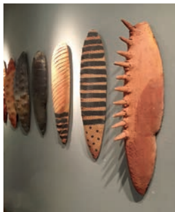
PER RAGNAR MØKLEBY